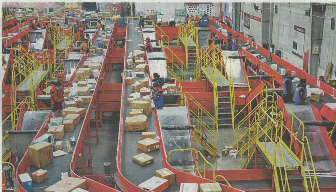
雙11臨近，物流紛紛準備，務求貨品秒達消費者手中

從11月1日零點開始，阿里菜鳥聯合世界各地物流企業，將鏡頭對準機器人聚集的物流倉庫、遠赴海外的中歐班列、大雪覆蓋的邊疆村落……直播展示全球300萬物流人、3000萬平米物流設施、3000多家物流公司、20多萬輛物流車和20多萬個快遞站點上的快遞員。