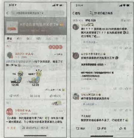
▲網友們「吐槽」今年的快遞速度 ▲熱話題衝上微博熱搜

「去年雙11，菜鳥與合作夥伴在一周內送達了超過18.8億個包裹。今年雙11物流與以往歷年不同，分成了兩波銷售，11月1日至3日是第一波，11月11日是第二波。一天變成了4天，將