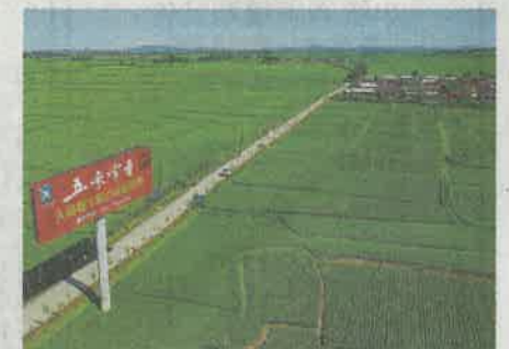
▲天貓數字糧倉種植基地，幫助農民實現「畝產一千美金」

入到農產品銷售。此外，快遞企業加速推進「快遞進村」工程，農村快遞服務能力明顯增強，幫助農村居民開啟便利新生活。