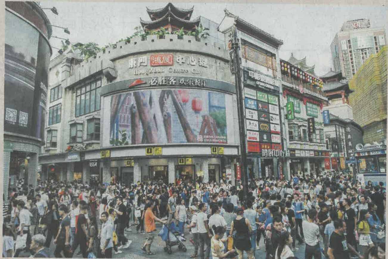
▲深圳羅湖已形成以「金融業、商務服務業、商貿業」3大支柱產業。圖為人氣旺盛的東門片區