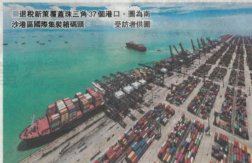
退稅新策覆蓋珠三角37個港口。圖為南沙港區國際集裝箱碼頭。

「下一步，南沙區金融局將跟進政策配套細則落地，加強整體規劃，推動更多具備承辦國際航運保險業務的保險機構到南沙落地、集聚，培育一批航運保險中介機構，健全航運保險人才的引進機制，同時加強與上海保險交易所等專業機構的合作，助力南沙建設航運樞紐。」