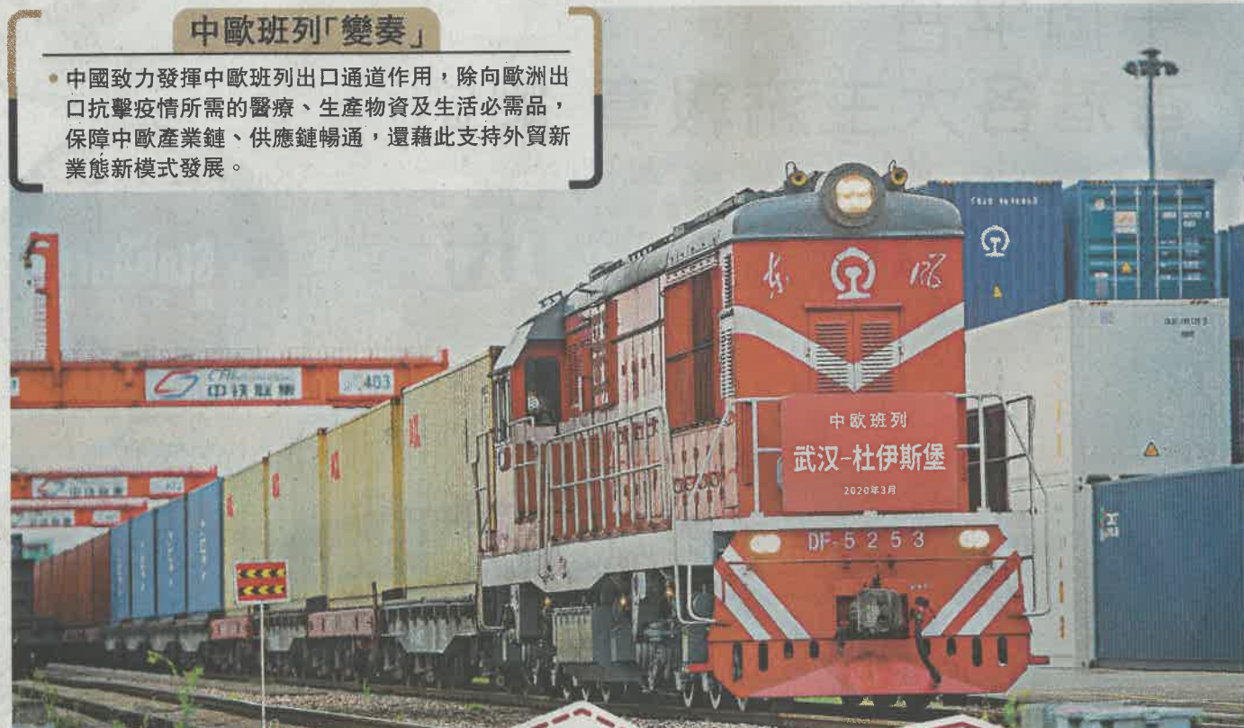
28日恢復常態化開行 ◀中國防疫形勢持續向好，中歐班列（武漢）今年3月資料圖片

中國致力發揮中歐班列出口通道作用，除向歐洲出口抗擊疫情所需的醫療、生產物資及生活必需品，保障中歐產業鏈、供應鏈暢通，還藉此支持外貿新業態新模式發展。