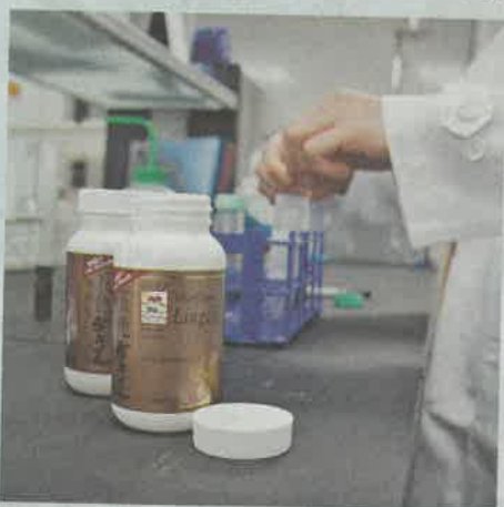
維特健靈認為，本港中藥保健品較內地品牌有優勢。