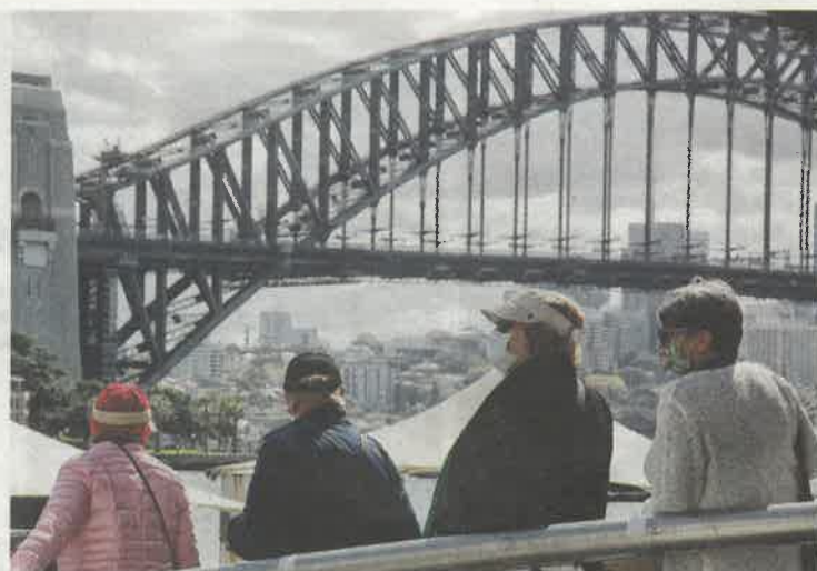
新冠疫情爆發，導致國際邊境關閉，遊客大減令澳洲旅遊業受到打擊。圖為遊客參觀悉尼著名的旅遊景點海港大橋。

在新冠疫情衝擊下，澳洲GDP繼首季按季下滑0.3%後，第二季再按季收縮7%，是1959年有紀錄以來最大跌幅。經濟連續兩季收縮，令澳洲陷入技術衰退，為近30年以來首次。在2008年金融海嘯期間，澳洲是全球唯一能避免衰退的主要經濟體，主要由於當時中國對其天然資源的強勁需求，支持了該國經濟。最新數據公布後，澳元兌美元由74美仙的兩年高位，輕微回落至73美仙。不過由於中美兩國的製造業數據理想，市場預期環球經濟好轉，澳洲股市昨升1.8%，是1個月來最大單日升幅。