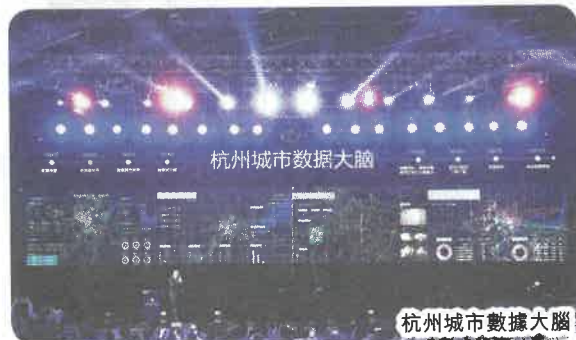
杭州城市數據大腦

政府工作報告還指出，將「最多跑一次」改革進行到底，使所有民生事項和企業事項開通網上辦理，60%以上的政務服務事項實現「掌上辦理」，力爭實現企業投資項目竣工驗收前審批「最多90天」。