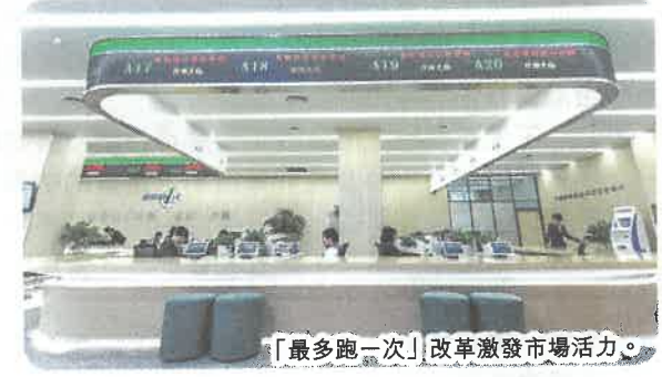
「最多跑一次」改革激發市場活力。

在對接國家戰略方面。將堅持全省域全方位融入長三角，推進嘉興全面接軌上海，提升舟山群島新區建設水平，合作共建G60科創走廊。抓好數字長三角、世界級港口集群、油氣貿易中心建設等。