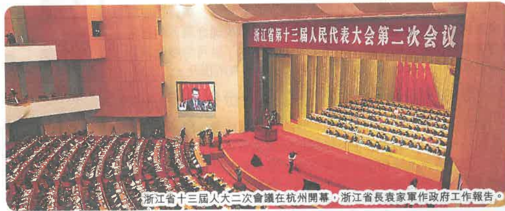
浙江省十三屆人大二次會議在杭州開幕，浙江省長袁家軍作政府工作報告。

2018年浙江數字經濟核心產業增加值增長13.1%，規模以上時尚、高端裝備、健康製造業增加值分別增長9.7%、9.2%、8%；規模以上高技術產業、高新技術產業、裝備製造業、戰略性新興產業增加值分別增長13.7%、9.4%、10%、11.5%。浙江建成「無人車間」、「無人工廠」66個，新增上雲企業12萬家、新增高新技術企業3,187家。