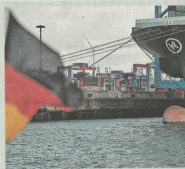
近年德國 GDP 增長表現