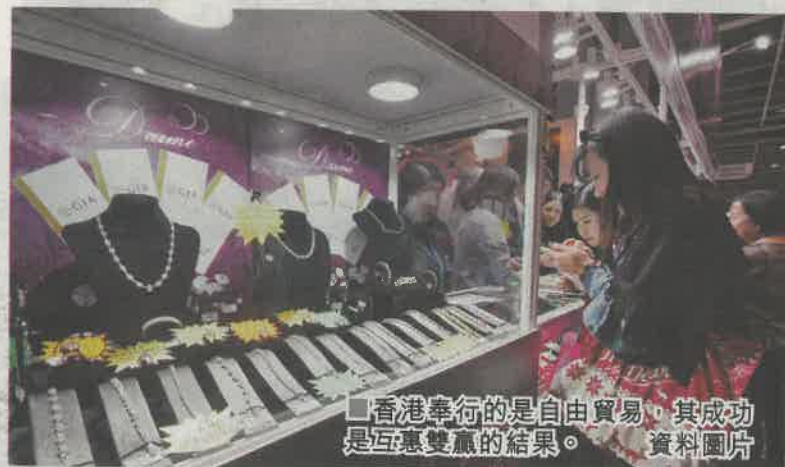
■香港奉行的是自由貿易，其成功是互惠雙贏的結果。 資料圖片