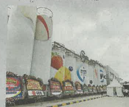
▲坐落於印尼西爪哇省芝卡朗的「蒙牛優益C工廠」