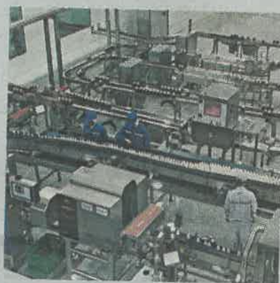
▲蒙牛印尼工廠主要生產優益C乳酸菌飲料和優酪乳