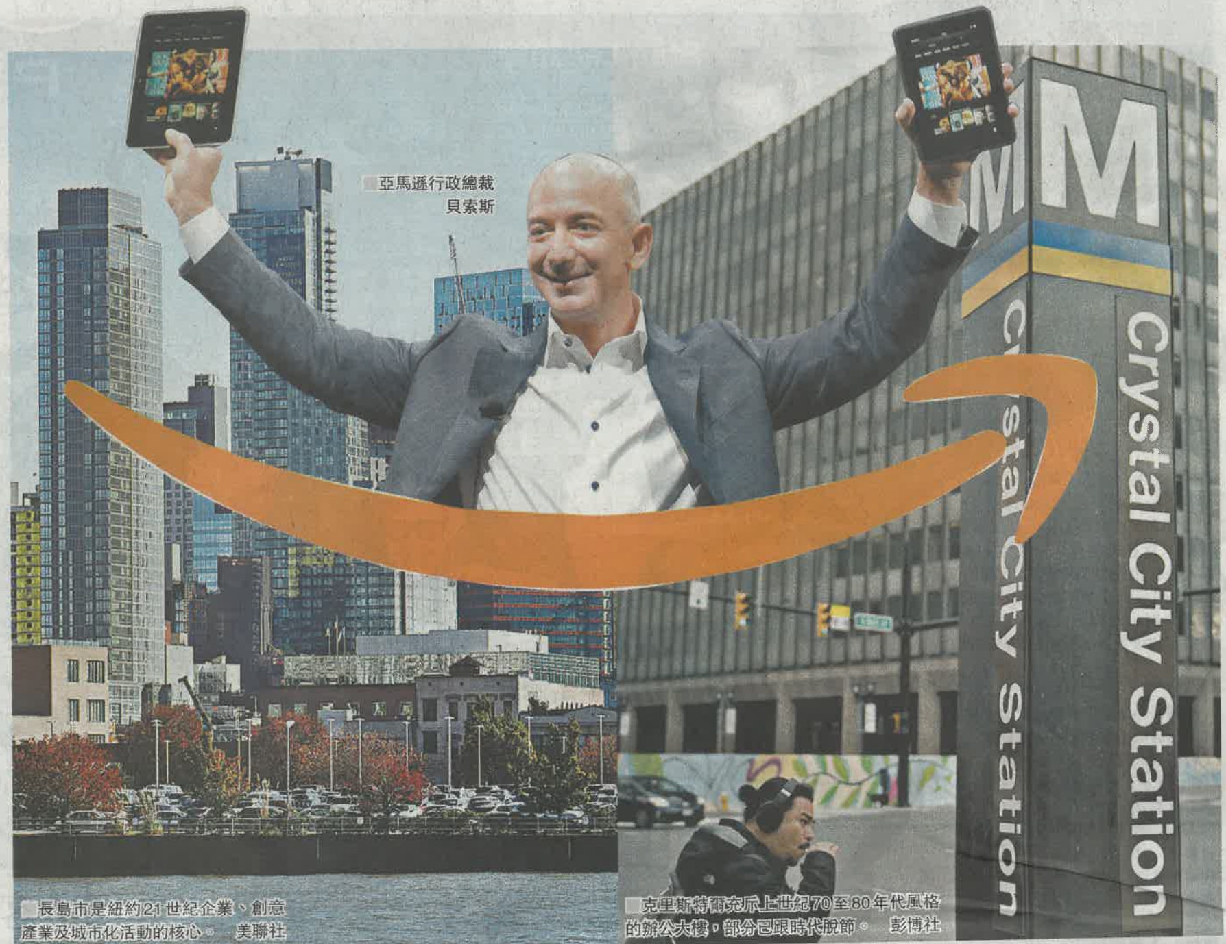
亞馬遜行政總裁 貝索斯

另一個新總部選址克里斯特爾靠近首都華盛頓，兩地僅相隔波托馬克河，市內設有里根國際機場及國防部五角大樓，在1990年代曾吸引不少企業到當地設