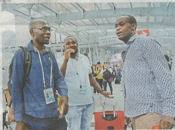
本屆廣交會，來自非洲的採購商數目在增長

Vlady表示，廣交會為海外採購商提供了很多機遇。尤其在同一行業中，可以在中國找到數量眾多的供應商，這意味着每個產品都有很多選擇，也意味着採購商可以深入了解每款產品的質量。「我作為一名美國採購商，總能在廣交會找到需要的產品。只要我還走得動，我還願意繼續參加廣交會。」