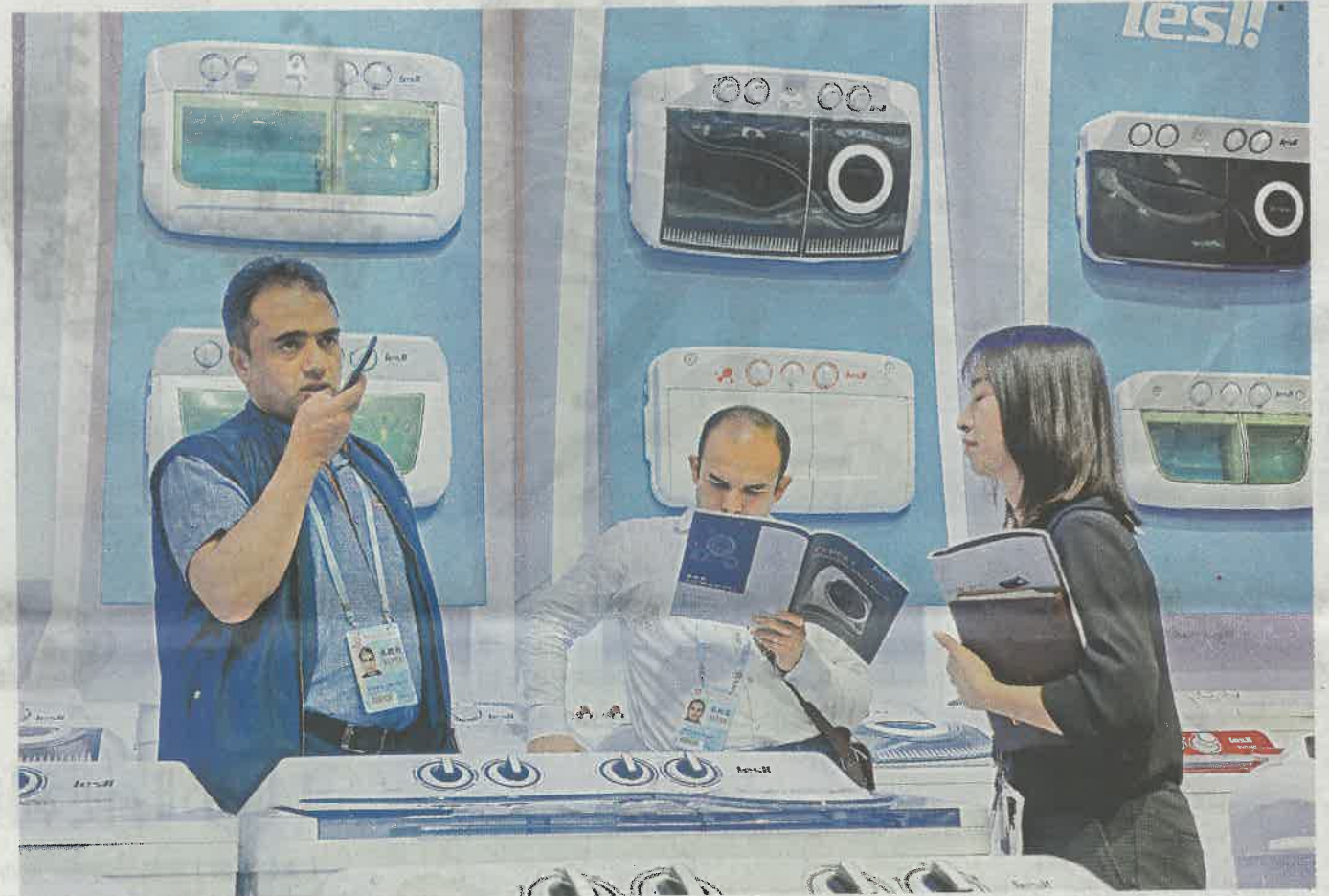
本屆廣交會中，來自「一帶一路」市場的成交佔3成

參展企業普遍反映，今年以來外貿出口穩中有升。廣交會調研顯示，接近9成的機電企業表示，企業今年前三季度出口額較上年同期增長或持平。其中，有8成企業認為，2018年全年出口情況好於上年或者持平。但考慮到國內原材料、勞動力等綜合要素成本持續上升、中美貿易摩擦影響加大的外部環境，參展企業同時認為明年的出口形勢不容樂觀。