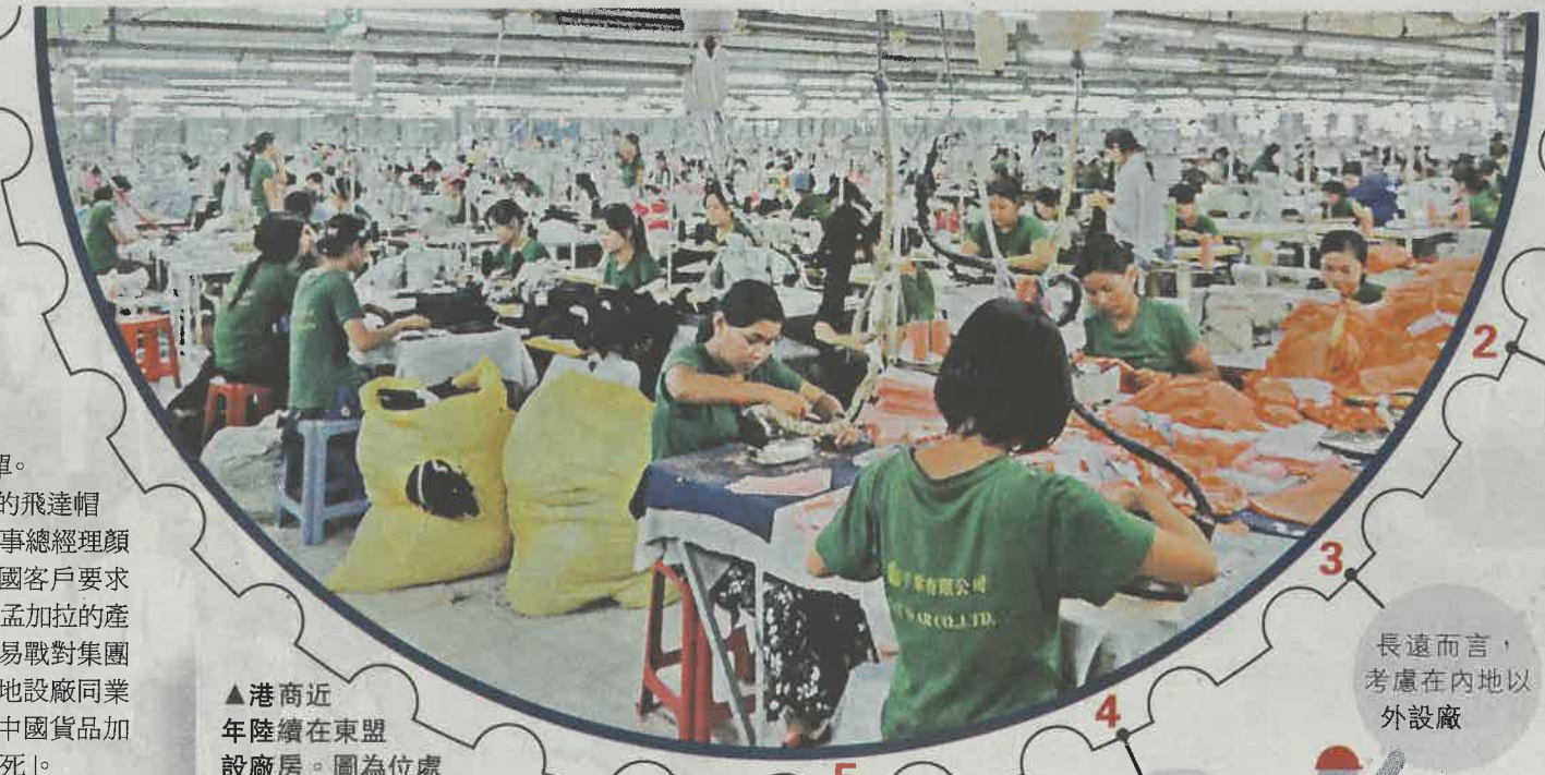
▲港商近年陸續在東盟設廠房。圖為位處緬甸的廠房