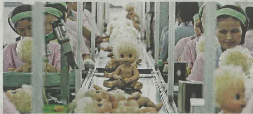
◀ 近年，內地廠房面對工人不足、工資上漲的問題

分析指出，自中美爆發貿易戰以來，不少美國買家已要求將產品轉至中國以外地區生產，以免受關稅的影響，若未來貿易戰進一步擴大，像華新手袋這類在海外有廠的公司將更受買家垂青，料