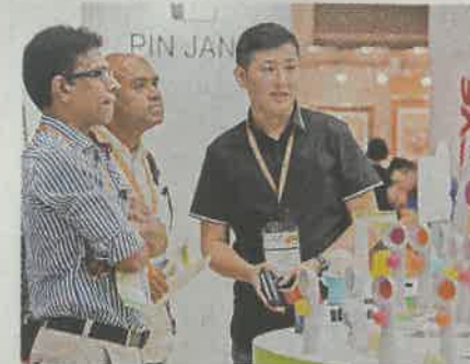
▲ 商會希望貿發局協助企業渡過難關

香港工業總會主席郭振華則表示，該會近期調查顯示，模具及塑膠製品、醫療輔助檢測工具設備、自動化工業設備受中美貿易戰影響較大，個別行業所受的影響佔產能20%，有廠商更表示有機會裁員。他認為，貿易戰對香港中小企影響不一，視乎產業類型，未來若中國對美國實施報復性關稅，將會令廠商入口原材料成本增加。