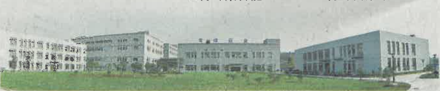
▼青峰藥谷龍頭企業——青峰醫藥集團