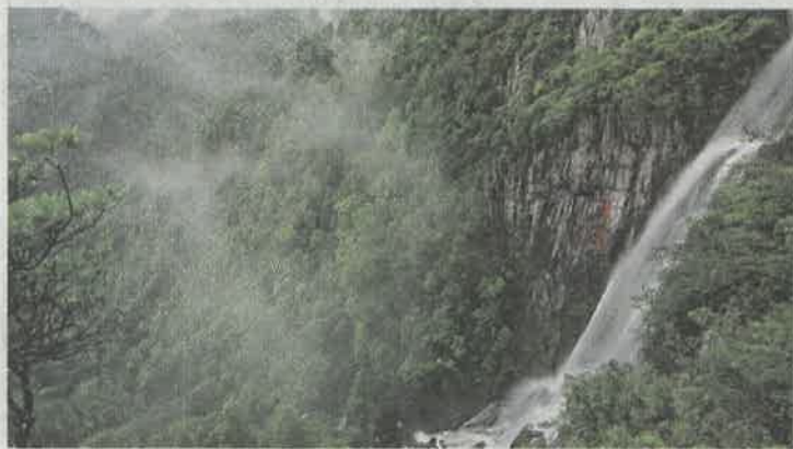
▲贛州東江源是港民主要飲用水源地

贛州，是客家先民中原南遷的第一站，500多座體量巨大的客家圍屋密集散落於青山綠水之間。據考古發現，從龍南、定南沿着東江