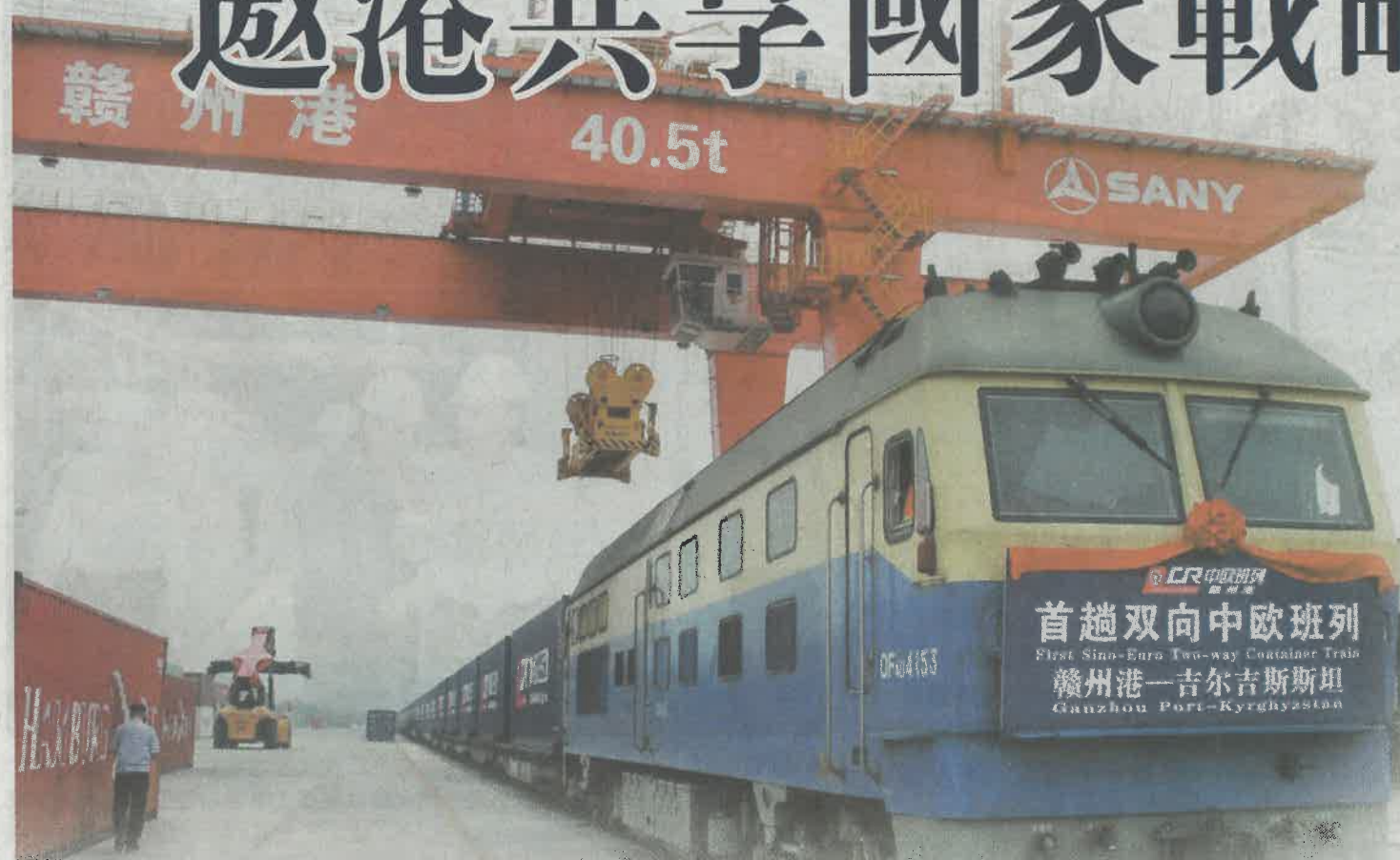
▲贛州市深度融入「一帶一路」，打造「一帶一路」的重要節點城市和國際貨物集散地

贛州市，江西省的南大門，江西省面積最大、人口最多的設區市，擁有千里贛江第一城、紅色故都、客家搖籃、江南宋城、世界橙鄉、世界鎬都、稀土王國和世界風水堪輿文化發源地等美譽。根據《國務院關於支持贛南等原中央蘇區振興發展的若干意見》，贛南等原中央蘇區定位為「全國革命老區扶貧攻堅示範區，全國稀有金屬產業基地、先進製造業基地和特色農產品深加工基地，重要的區域性綜合交通樞紐，我國南方地區重要的生態屏障，紅色文化傳承創新區」。