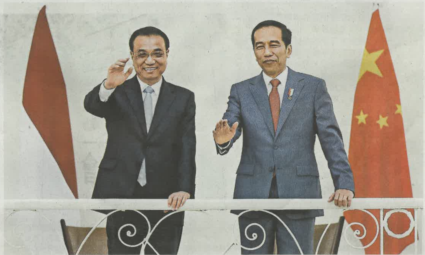
▲7日，中國國務院總理李克強與印尼總統佐科在茂物總統府舉行會談

會談後，李克強與佐科共同見證了雙方有關合作文件的簽署，其後共同會見記者。李克強積極評價會談成果，他表示，作為世界主要經濟體，中國印尼應共同努力