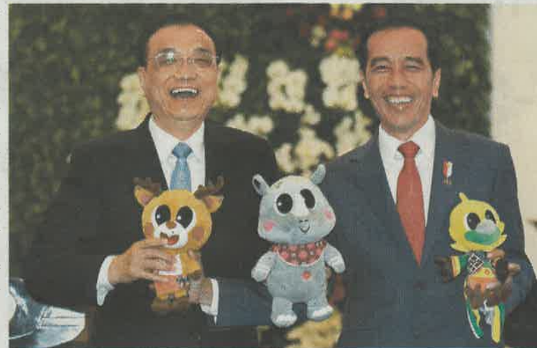
▶ 李克強與佐科在會見記者時，舉起今年8月印尼雅加達亞運會的吉祥物花鹿阿東、犀牛卡卡和天堂鳥寶寶合照

此外，東盟是中國周邊外交優先方向和「一帶一路」建設重點地區，也是中國推動建設新型國際關係、構建人類命運共同體的重要夥伴。許利平指出，印尼是東盟最大的經濟體，中國和印尼間的合作必將為推動中國與東盟間在經貿、投資等各個領域的合作起到引領和示範的作用。