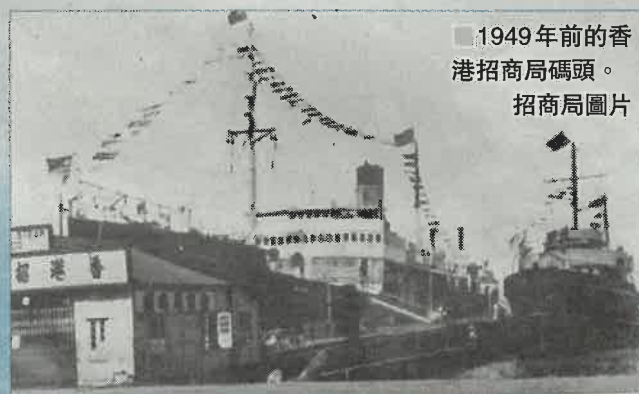
1949年前的香港招商局碼頭。