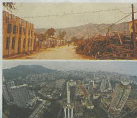
上世紀70年代末，招商局在深圳創辦蛇口工業區。上圖：開發前的蛇口老街。下圖：高樓林立的蛇口工業區。