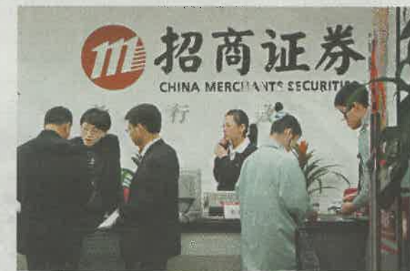
招商證券致力爭取港澳台居民投資A股的市場機遇。資料圖片

截至2016年底，招商證券在國內114個城市設有226家證券營業部和12家分公司，已構建起國內國際一體化的綜合證券服務平台。2012年招商局成立招商局資本，推進集團內部基金整合，建立直投基金管理的統一平台；截至2016年底，其管理總資產近1,700億元（人民幣，下同）。招商局旗下還有招商基金、博時基金，基金管理總規模均超過1萬億元。