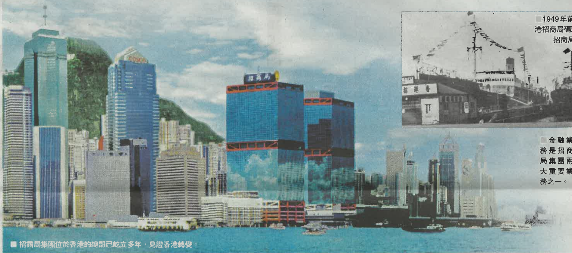
招商局集團位於香港的總部已屹立多年，見證香港轉變