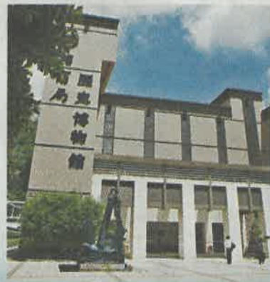
位於深圳蛇口的招商局歷史博物館。

要契機。作為重要的駐港中資企業，招商局發揮佈局優勢，攜手港企對外拓展，積極與香港企業一起為中國企業「走出去」提供支持，共同創造新的投資發展機會。招商局在「一帶一路」上的中白工業園、吉布提自貿區、多哥等重大項目，歡迎香港企業參與建設和提供服務，實現共贏。