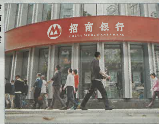
金融業務是招商局集團兩大重要業務之一。