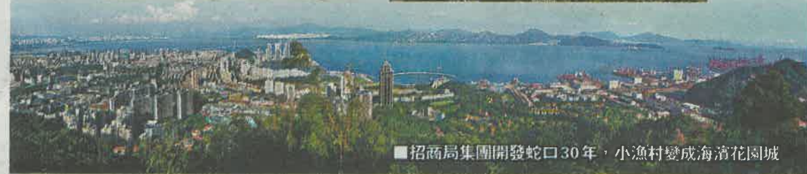
招商局集團開發蛇口30年，小漁村變成海濱花園城