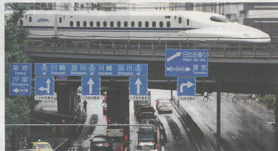
日本第2季實際GDP初值按季增長1%，折成年率增長4%，遠超美國上季的2.6%年率增長，成為七大工業國中增速最高成員。