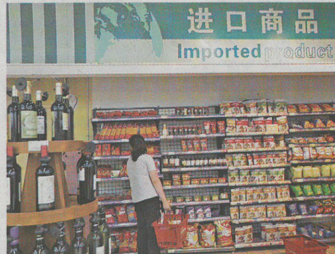
■海關總署認為，中國內地經濟穩中向好，帶動進口量持續增加。

他又表示，當局各項外貿穩增長政策措施效應持續顯現，以及去年同期基數較低，都是今年